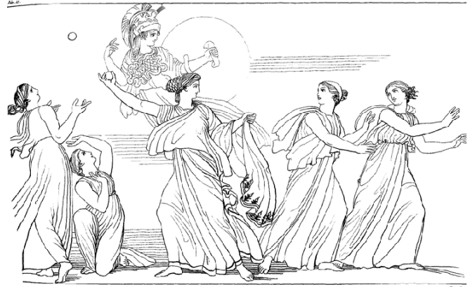
Nauclypeus et ses femmes après avoir lavé au fleuve le linge qu'elles avaient apporté, jouent toutes ensemble à la paume.

Τον ξύπνησαν την άλλη μέρα κάποιες χαρούμενες φωνές. Ήταν η βασίλοπούλα Ναυσικά, που είχε πάει με τις φίλες της να πλύνουν και, αφού τελείωσαν, έπαιζαν τόπι. 1 Η Ναυσικά λυπήθηκε τον ξένο και τον οδήγησε στο παλάτι του πατέρα της, του Αλκίνοου. Ο Αλκίνοος τον φιλοξένησε, κι όταν κάθισαν να φάνε, ο μουσικός του παλατιού, ο Δημόδοκος, έπαιζε τη λύρα του και τραγουδούσε τα κατορθώματα των Αχαιών στην Τροία. 2 Ο Οδυσσέας τότε συγκινήθηκε, τους φανέρωσε ποιος ήταν και τους διηγήθηκε τις περιπέτειές του.