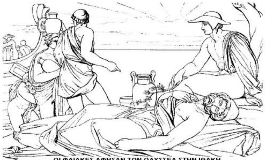
ΟΙ ΦΑΙΑΚΕΣ ΑΦΗΣΑΝ ΤΟΝ ΟΔΥΣΣΕΑ ΣΤΗΝ ΙΘΑΚΗ

Χαράματα έφτασαν στην Ιθάκη. 3 Ο Οδυσσέας κοιμόταν και γι' αυτό τον σήκωσαν στα χέρια και τον ξάπλωσαν στην αμμουδιά. Έβαλαν δίπλα του τα δώρα που του χάρισαν κι έφυγαν.