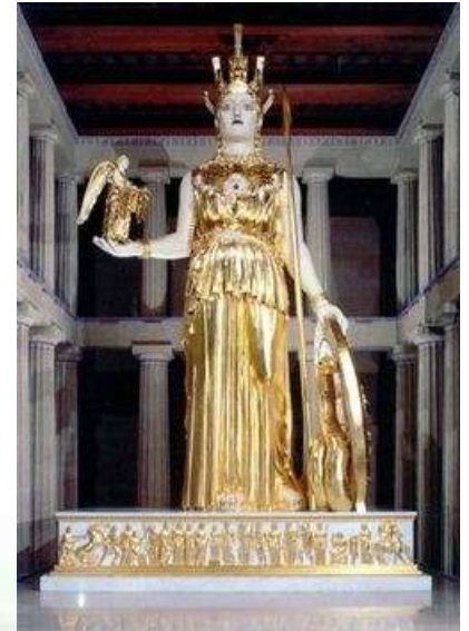
Χρυσελεφάντινο άγαλμα της Αθηνάς Παρθένου (περ. 440-438 π.Χ.)