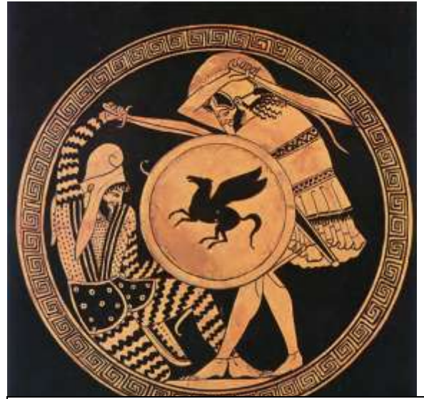
Μονομαχία Έλληνα με Πέρση στρατιώτη (Σκωτία, Εδιμβούργο, Βασιλικό Μουσείο)

Οι Πέρσες επιτέθηκαν πρώτοι με όλες τους τις δυνάμεις. Συνάντησαν όμως την αντίσταση των ενωμένων Ελλήνων και αναγκάστηκαν να υποχωρήσουν. Ένας Σπαρτιάτης μάλιστα σκότωσε τον Μαρδόνιο . Μετά από αυτό το γεγονός αποφάσισαν να πάρουν τον δρόμο του γυρισμού, αφήνοντας πίσω τους πολλούς νεκρούς.