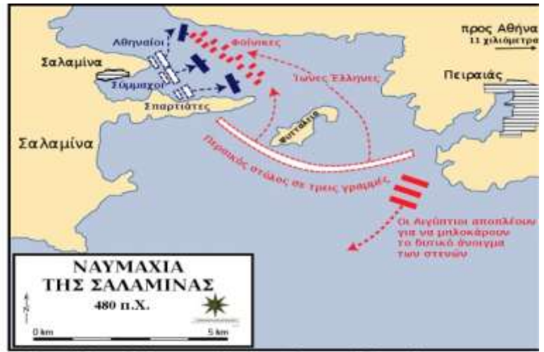
Το 480 π.Χ έγινε η Ναυμαχία της Σαλαμίνας, στο στενό της Σαλαμίνας.

Μόλις δόθηκε το σύνθημα της επίθεσης, τα ελληνικά πλοία έπλευσαν με δύναμη προς τα περσικά. Τα πρώτα περσικά πλοία δεν άντεξαν την επίθεση και υποχώρησαν. Το ίδιο έκαναν και τα άλλα, καθώς δεν μπορούσαν να κινηθούν εύκολα στο στενό. Η ναυμαχία κράτησε ως τ' απόγευμα. Οι Πέρσες έφυγαν, ενώ η γύρω θάλασσα είχε γεμίσει από συντρίμια.