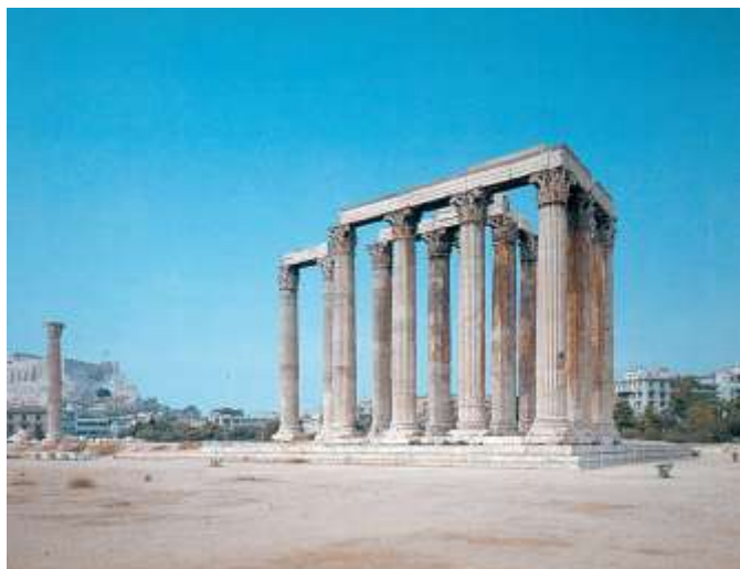
Ο ναός του Ολυμπίου Διός, που βρίσκεται στην Αθήνα, θεμελιώθηκε από τον Πεισίστρατο.

Όταν πέθανε, άφησε την εξουσία στον γιο του τον Ιππία. Οι Αθηναίοι όμως δεν τον ήθελαν. Έκαναν επανάσταση αργότερα και τον έδιωξαν.