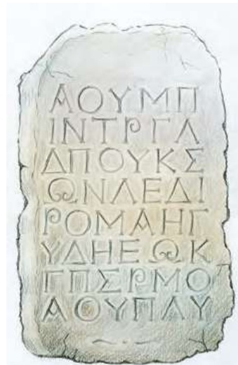
Οι νόμοι του Δράκοντα ήταν χαραγμένοι σε μαρμάρινες πλάκες.

Το έδαφος όμως της Αττικής ήταν φτωχό και δεν έφτανε να θρέψει τους κατοίκους. Πολλοί ήταν χρεωμένοι και διαμαρτύρονταν. Στο δικαστήριο που πήγαιναν δεν έβρισκαν δίκιο, γιατί οι νόμοι ήταν άγραφοι και οι δικαστές ευγενείς. Για να σταματήσει η αναστάτωση, οι ευγενείς ανέθεσαν στον Δράκοντα να γράψει τους νόμους (624 π.Χ.). Οι νόμοι όμως του Δράκοντα ήταν τόσο σκληροί, που κάποιοι είπαν ότι ήταν γραμμένοι με αίμα. 3